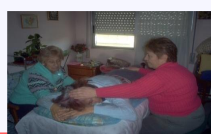
Figura 8: Reiki en parrilla