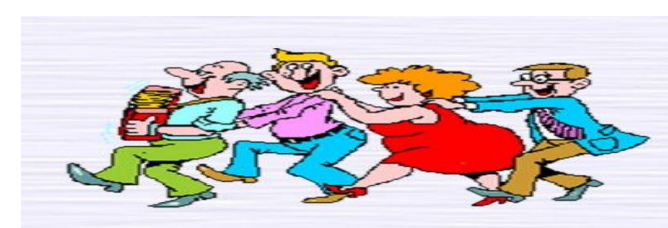
Figura 2: dibujo humor.