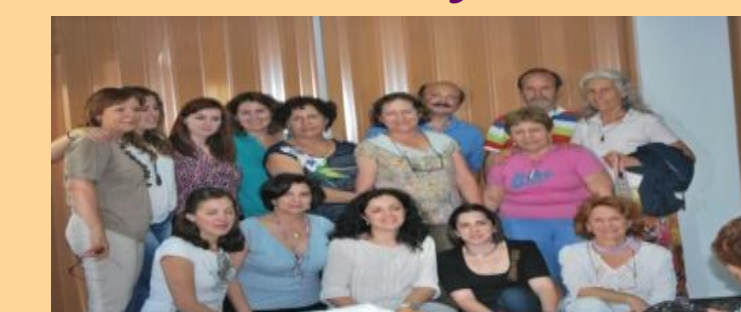
Figura 5: 2013 alumnos COEMUR de Reiki