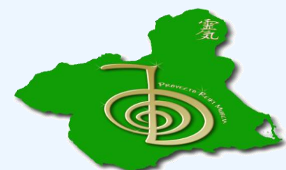
Figura 4: anagrama proyectoreikiMurcia

★ General : Revisión bibliográfica de la literatura científica existente en Terapia Integral Reiki desde enfermería.