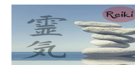
Figura 3: reiki