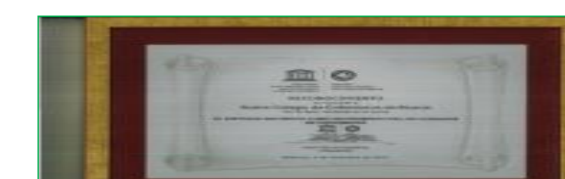
Figura 7: Reconocimiento